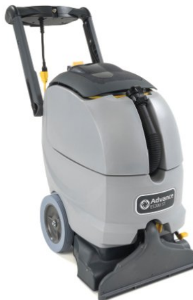
Den bild som visas kanske inte överensstämmer med den offererade modellen